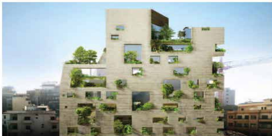
← Vue du projet Stone Gardens : une archéologie verticale. © DGT (Dorell, Ghotmeh, Jone / Architecture) ↓ Un monolithe de terre en rapport au sol, insertion du projet dans le port de Beyrouth. © DGT (Dorell, Ghotmeh, Jone / Architecture)