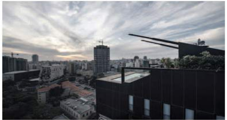
↑ Résidence NEK, sur la toiture un char prêt à confronter la ville par DW5 / BERNARD KHOURY

En cours de réalisation également, la tour Plot # 450, conçue par l'architecte Bernard Khoury. Elle surplombe le port de Beyrouth. Un territoire réglementé où l'on peut encore assister à la manifestation physique du peu d'autorité gouvernementale. Tel que le raconte l'architecte, le projet célèbre ce phénomène spécifique en extrayant des éléments du port, en les déplaçant et les greffant au projet. Une grue est installée de manière permanente près de la tour. Elle est l'icône du port de Beyrouth, d'une ville en construction permanente. Elle plane au-dessus du bâtiment pour abriter des caméras de surveillance et devenir la sentinelle du site.