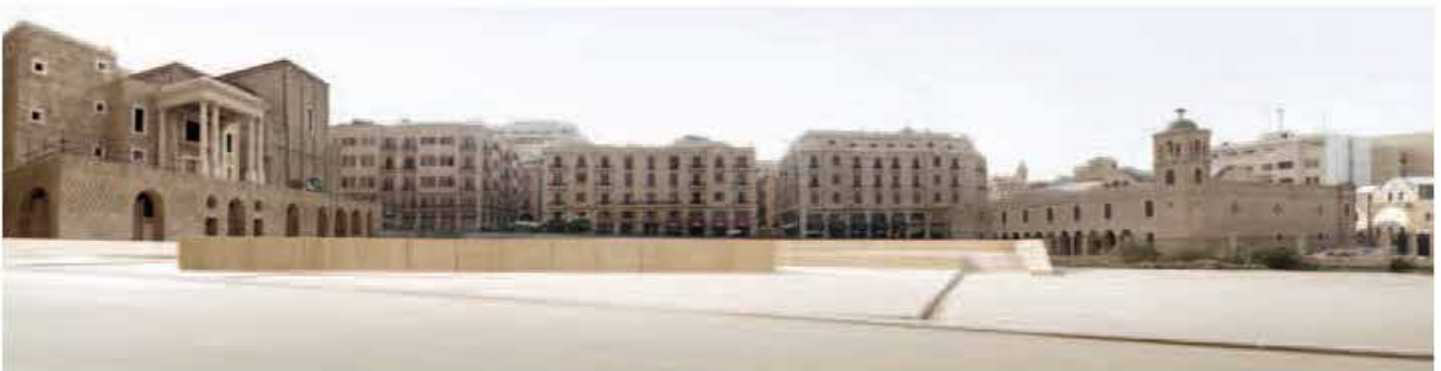
↓ Daréh, Mémorial de Hariri un espace public ouvert, Atelier Marc Barani © Fabrice Carbone