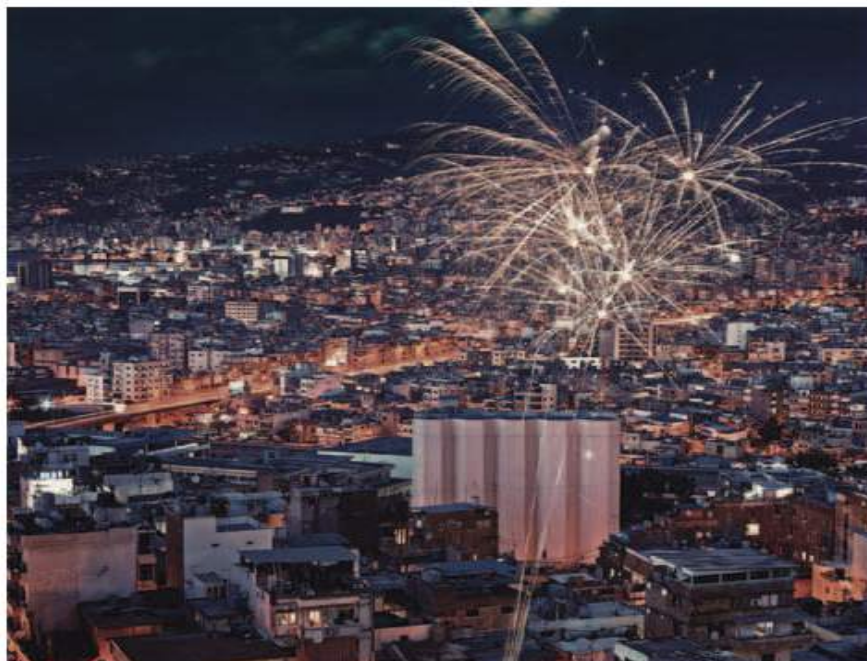
← La Frénésie, 2014

Il est difficile de ne pas tomber sous le charme de cette ville, de ne pas retrouver en elle une nouvelle façon, plus riche, plus surprenante, plus multiple, de fabriquer nos villes ; mais il est important de questionner sa capacité à unir, inclure la diversité de tous ses citoyens (leurs différentes classes, religions, origines), et son aptitude à offrir les scènes « publiques » nécessaires à la fabrication d'une culture du collectif, au renouvellement de sa mémoire, et à l'acceptation de ses origines.