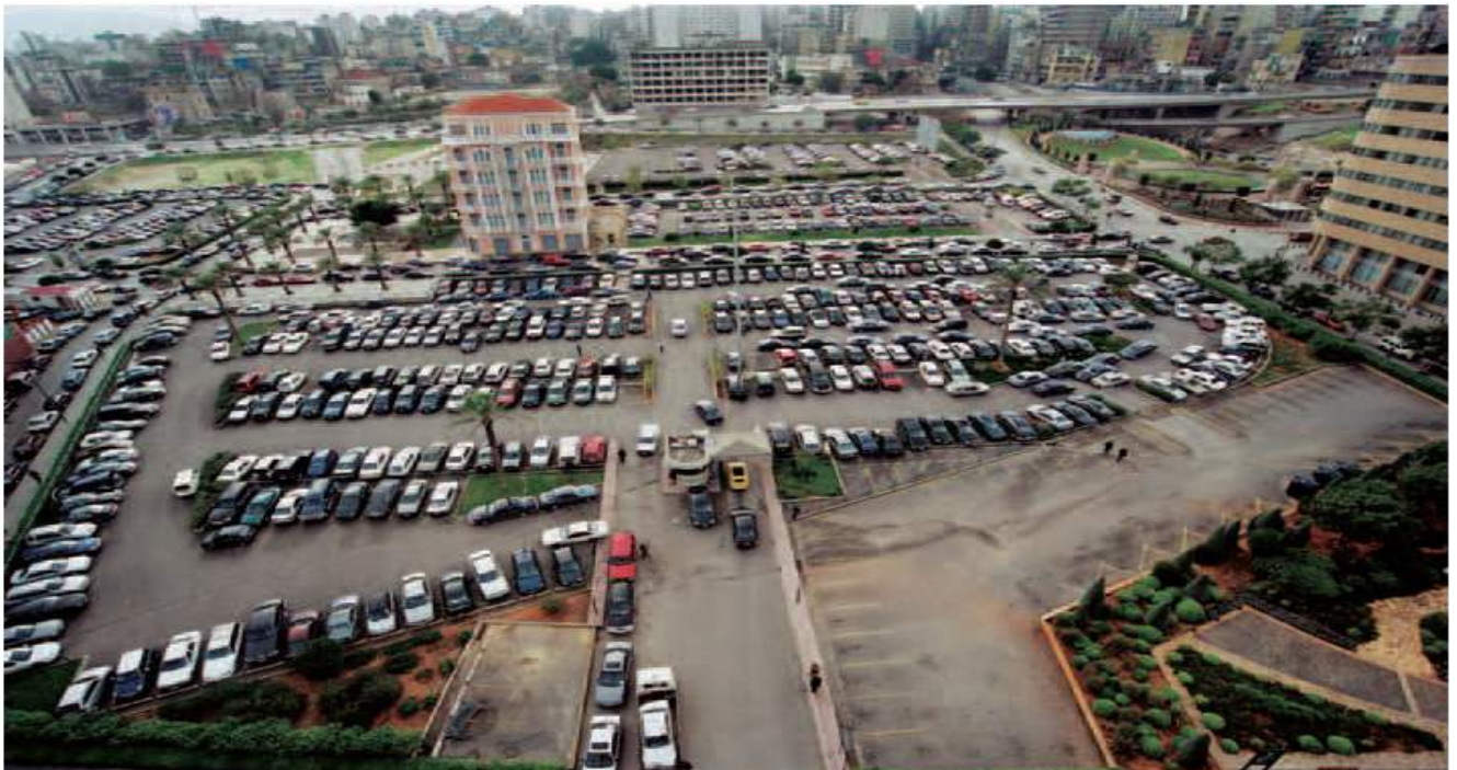
↑ La place Riyadh Solh envahie par les voitures, 2002