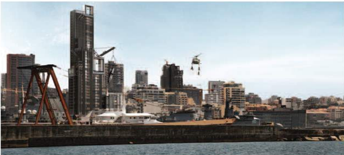
↓ Vue de la tour sur Plot #450 et de la grue de la surveillance planant de côté