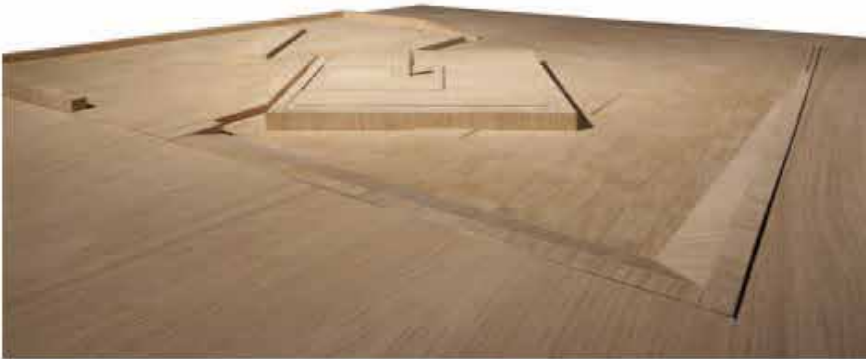
← Daréh, Mémorial de Hariri, l'Atelier Marc Barani © Maquette par VOLINCE ARCHITECTURE

« PLUTÔT QU'UN MAUSOLÉE VOUÉ À S'EFFACER DANS L'URBANISATION MOUVANTE DU CENTRE BEYROUTHIN, J'AI CHOISI LE VIDE, C'EST À DIRE LE CIEL, EN REDONNANT À LA TOMBE SA SIGNIFICATION FONDAMENTALE : LE LIEN DIRECT QU'ELLE ÉTABLIT ENTRE LA TERRE ET LE CIEL » MARC BARANI »