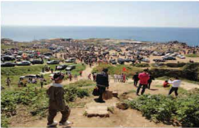
↑ Photo du Nowruz, fête des Kurdes à Daliéh, Beyrouth. Site menacé par le projet de centre balnéaire en conception chez OMA