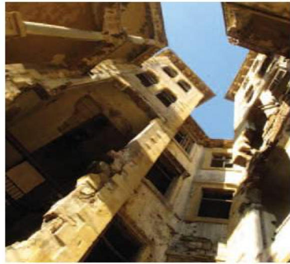
↑ Vue du vide intérieur à la Maison Jaune © Lina Ghotmeh, 2011