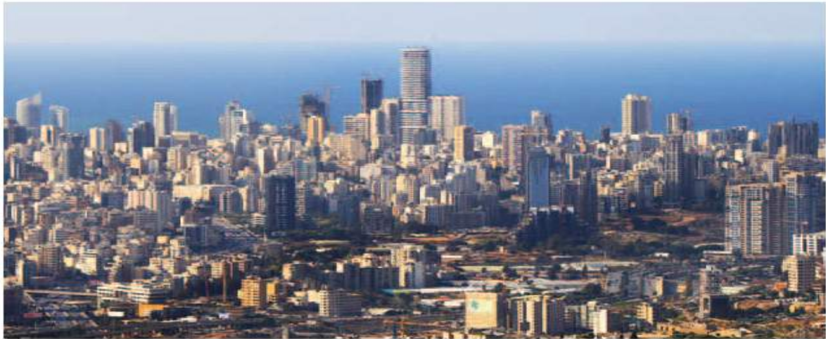
↑ Skyline de Beyrouth, vue de Skygate, Nabil Gholam Architects 10 Years of Now