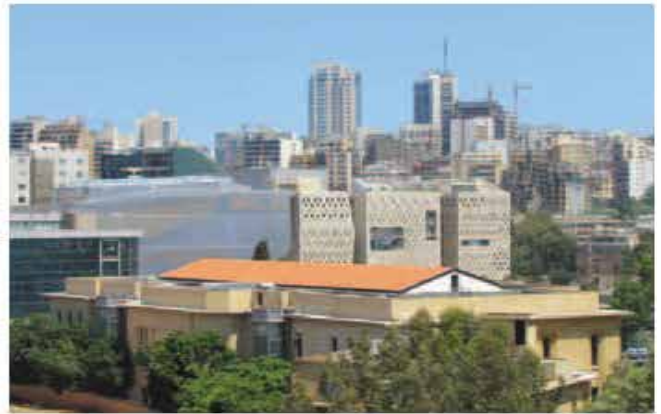
↑ L'université Saint-Joseph par YTAA & 109 Architects

« PLUTÔT QU'UN MAUSOLÉE VOUÉ À S'EFFACER DANS L'URBANISATION MOUVANTE DU CENTRE BEYROUTHIN, J'AI CHOISI LE VIDE, C'EST À DIRE LE CIEL, EN REDONNANT À LA TOMBE SA SIGNIFICATION FONDAMENTALE : LE LIEN DIRECT QU'ELLE ÉTABLIT ENTRE LA TERRE ET LE CIEL » MARC BARANI »