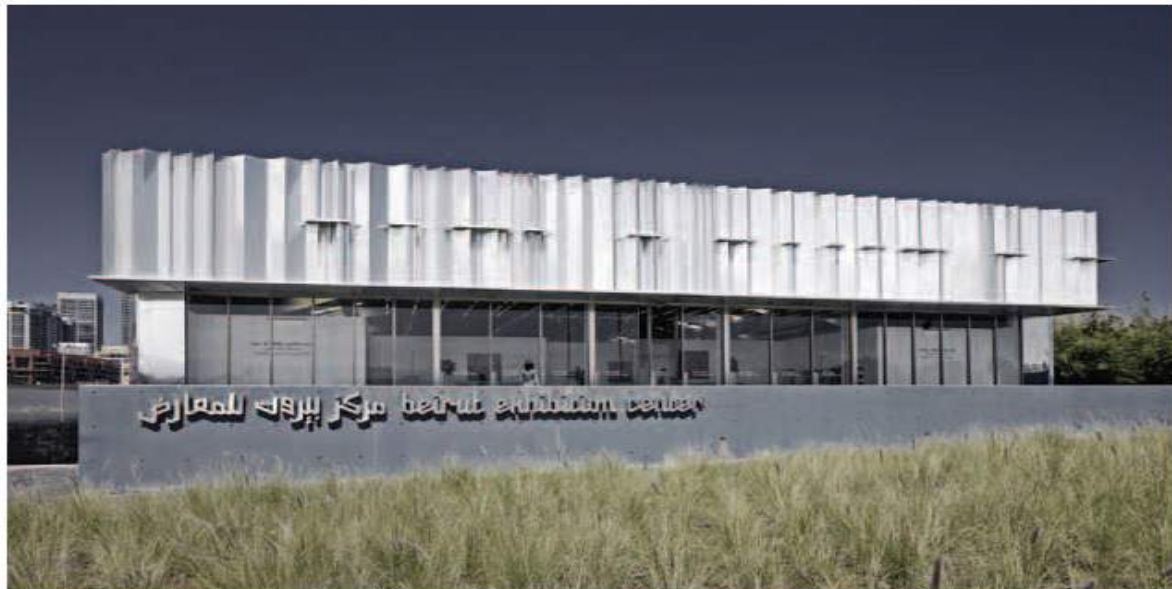
↑ Beirut Exhibition Center par L.E.F.T Architects / reflet de Beyrouth en mutation © Joe Harrouzo

Tous ces projets sont à mon avis de multiples ouvertures pour la création d'un espace collectif, un espace de mémoire où l'architecture semble établir des moyens de penser ses origines pour créer un vivre ensemble. Ces exemples révèlent à mon sens la nécessité de penser, travailler et même jouer avec l'histoire de la ville et les différentes strates qui la constituent, le rapport au sol ou les multiples traces résistantes au temps des architectures-témoins.